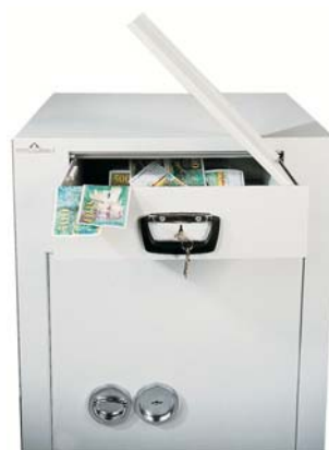
Tiroir dépôt fermant à clé double panneton. (possible sans clé)