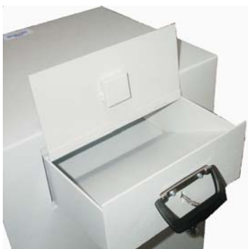
Tiroir de dépôt inversé