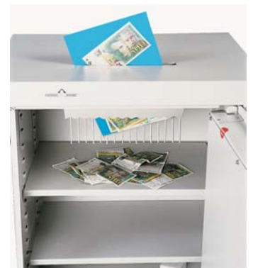
Fente tirelire de dépôt de 300 mm x 20 mm avec griffes anti-pêche