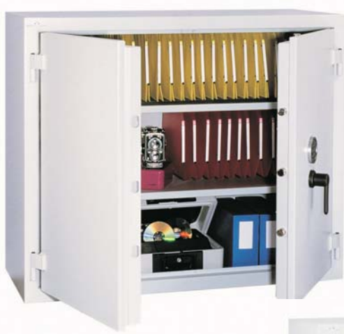
Star Protect 500

Une réponse fiable aux exigences relatives au vol et à l'indiscrétion émises par les différentes instances de police, assurances et entreprises chargées de la sécurité des biens