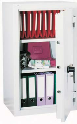
Star Protect 250