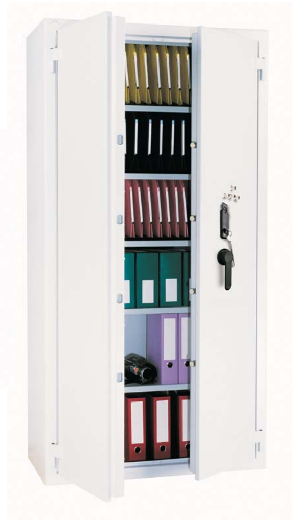
Star Protect 900